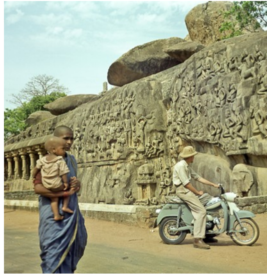
Das weltberühmte Relief von Mahabalipuram

Wir können schließlich auch den Felsrücken erahnen, den unser Reiseführer beschreibt, und mit ihm auch den Höhlentempel, der in den Fels hineingehauen wurde und die sogenannten fünf Rathas, die monolithisch aus dem Fels herausgemeißelt wurden.