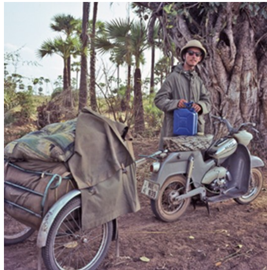
Auf dem Weg von Tensa nach Keonjhargarh