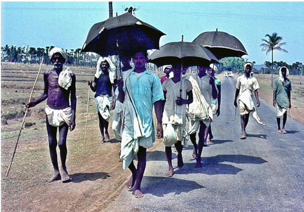
Auf dem Weg von Tiruchy nach Dindigul

Als wir schließlich am Abend die Stadt Tiruchy erreichen, haben wir sogar unser vorgemmenes Pensum überschritten.