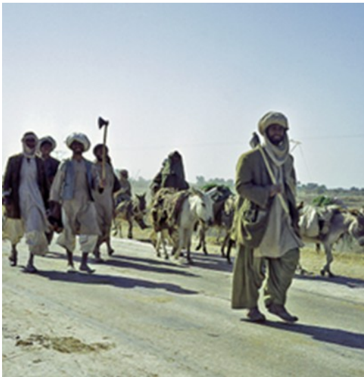
Nomaden, von Cuttack nach Puri

Da auch die Monsunwinde, die, wie jedes Jahr, den großen Regen über den indischen Kontinent bringen werden, noch nicht eingesetzt haben, liegt das Land noch ausgetrocknet da, und so können wir die Flussbetten an den Übergängen ohne Probleme durchfahren.