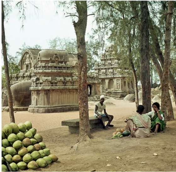
In der Anlage von Mahabalipuram

Da die einzelnen Bauwerke sehr spärlich beschildert sind, wenn überhaupt, dann nur in der landesüblichen Schrift, fahren wir mit unserem Roller und einer Karte von Monument zu Monument.