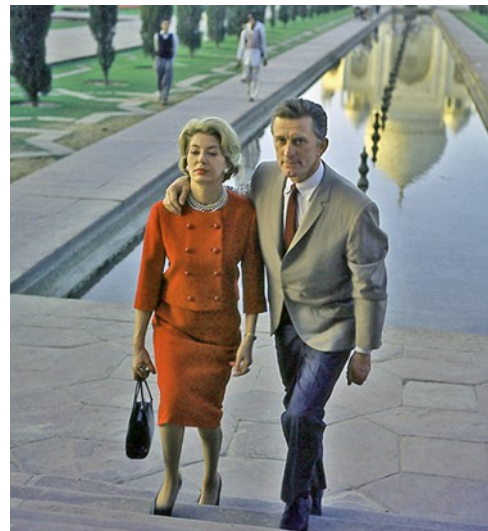
Prominente Besucher, Kirk Douglas und Frau

Als wir am Ende der Führung in die Gartenanlage zurückkommen, läuft uns dort ein westlich gekleidetes Paar über den Weg. Dabei kommt mir der Herr mit der Sonnenbrille neben der Dame irgendwie bekannt vor. Doch wenig später fällt mir der Groschen, denn das waren eben der amerikanische Filmschauspieler Kirk Douglas und seine Frau, die an uns vorbeigezogen sind, ohne Bodyguard und ohne jeglichen Anhang.