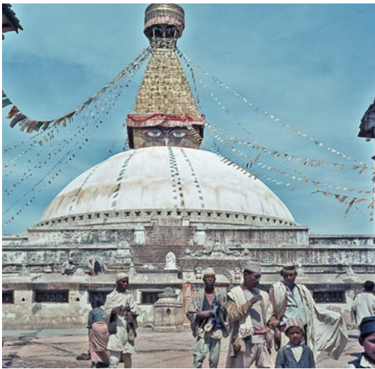
Der Stupa von Bodhnath, Kathmandu

Noch am Nachmittag fahren wir nach Bodnath hinaus, zu der Kloster- und Stupa-Anlage des Ortes.