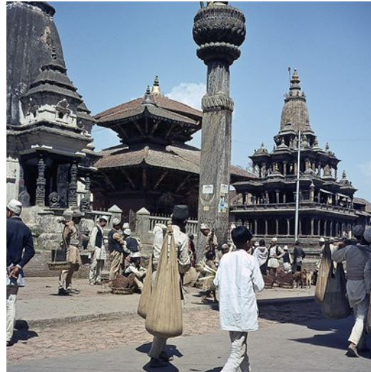
Krishna-Tempel, Yoganarendramalla-Säule, Patan