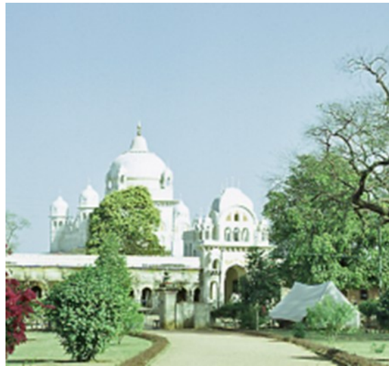
Zelten im Park von Khajuraho

So fahren wir erst einmal am Fluss entlang und bleiben am Ende im losen Sand der Piste stecken.