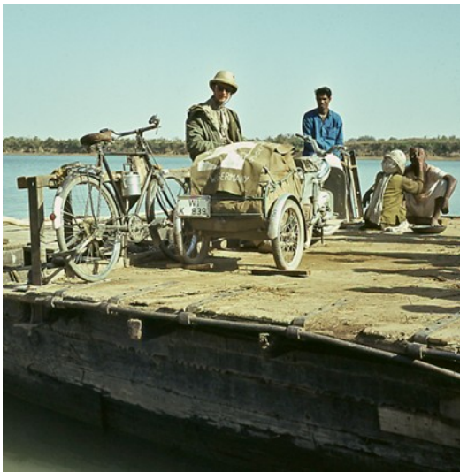
Mit der Fähre Richtung Khajuraho

Doch an der Baustelle ist kein Führungspersonal auszumachen. Nur Einheimische wuseln dort herum und wenn wir die Leute nach dem Weg fragen wollen, blicken sie uns nur stumm und ratlos an.