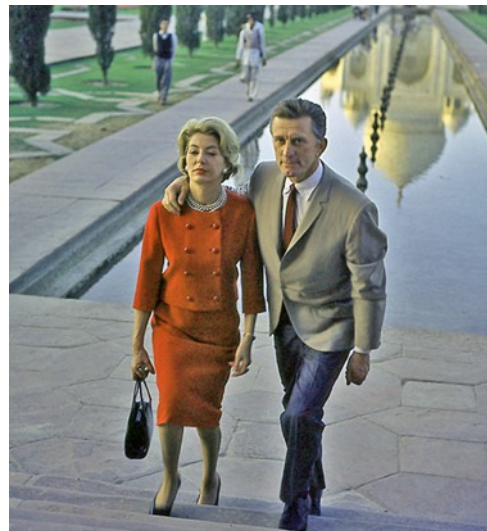
Prominente Besucher, Kirk Douglas und Frau

Als wir am Ende der Führung in die Gartenanlage zurückkommen, läuft uns dort ein westlich gekleidetes Paar über den Weg. Dabei kommt mir der Herr mit der Sonnenbrille neben der Dame irgendwie bekannt vor. Doch wenig später fällt mir der Groschen, denn das waren eben der amerikanische Filmschauspieler Kirk Douglas und seine Frau, die an uns vorbeigezogen sind, ohne Bodyguard und ohne jeglichen Anhang.