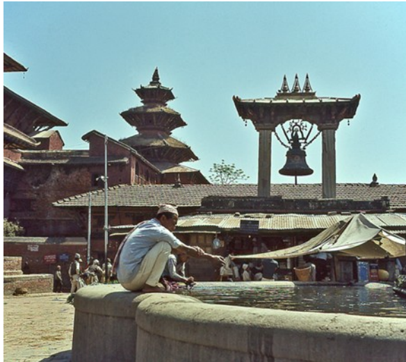
Palast-und Tempelbezirk, Patan