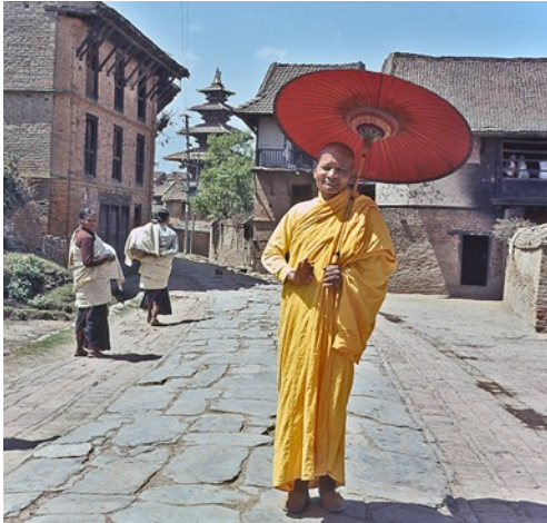
Vorsteher eines buddh. Klosters