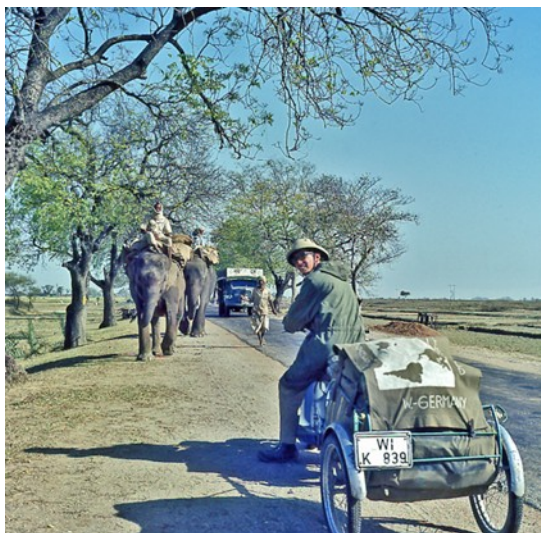
Von Sasaram nach Durgapur

Da wir aber die entsprechende Aufforderung wegen unserer momentanen Liquiditätsschwäche überhören, kommt es wohl zu einer Verärgerung der beiden Betreuer. Denn nun gibt einer der beiden ein akustisches Kommando an seinen Elefantenbullen mit den prächtigen Stoßzähnen, der nun langsam auf mich zukommt und mit erhobenem Rüssel in einem Abstand von etwa zehn Zentimetern vor meinem Gesicht stehen bleibt. Dabei ertönt erneut die Stimme des Mahouts: „Bakschisch! Bakschisch!“