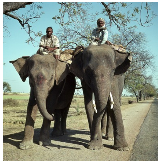
Aus der Nähe betrachtet

Nachdem wir immer noch nicht gewillt sind zu zahlen, kommt ein weiteres Kommando und nun trifft mich aus dem Elefantenrüssel ein Gemisch aus Luft und Wasser mitten ins Gesicht. Ich wieder mit ihren Betreuern in Bewegung und ziehen an uns vorbei, ohne uns noch eines Blickes zu würdigen.