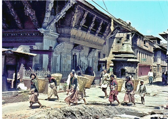
Palastbezirk von Patan