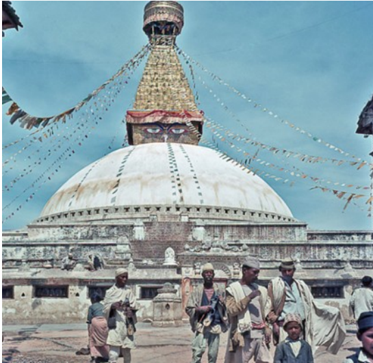
Der Stupa von Bodhnath, Kathmandu

Noch am Nachmittag fahren wir nach Bodnath hinaus, zu der Kloster- und Stupa-Anlage des Ortes.