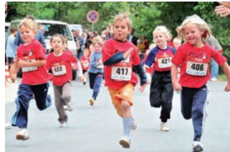
Kinderlauf beim 2. TSG Altenhain 1900 e.V. –ARQUE- Wuzzelauf 2009