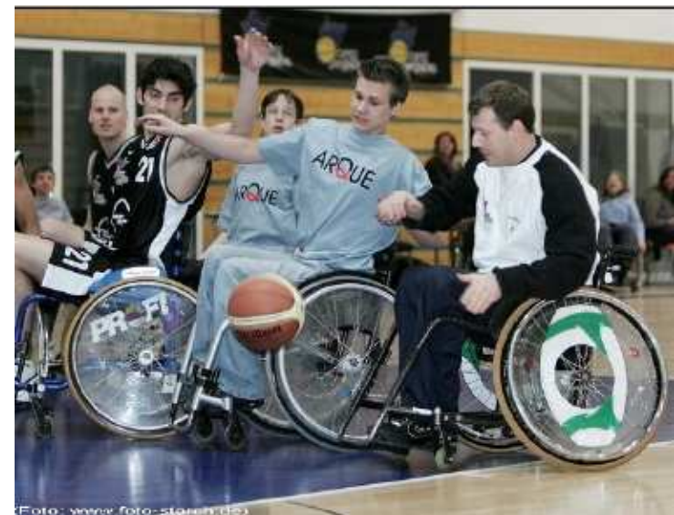
ARQUE - Skyliners

Kümmern heißt dabei, sich den medizinischen, pflegerischen und sozialen Aufgaben zu stellen und insbesondere auch jungen Eltern Mut zu machen, wenn in der Familie ein Kind mit einer solchen Behinderung geboren wird - und dies passiert in Deutschland mit einer Wahrscheinlichkeit von 1 : 1.000.