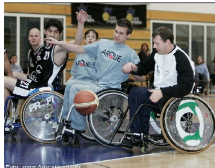
ARQUE - Skyliners

Kümmern heißt dabei, sich den medizinischen, pflegerischen und sozialen Aufgaben zu stellen und insbesondere auch jungen Eltern Mut zu machen, wenn in der Familie ein Kind mit einer solchen Behinderung geboren wird - und dies passiert in Deutschland mit einer Wahrscheinlichkeit von 1 : 1.000.